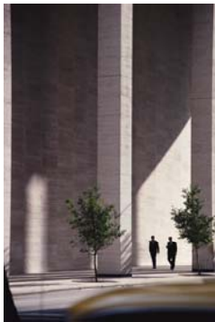
Die TechConsult GmbH begleitet die Marktbearbeitung

„Die Module der TechConsult-Services ergänzen sich zu einem wertvollen Ganzen und bieten optimale Synergien, um unseren Informationsbedarf zu decken“