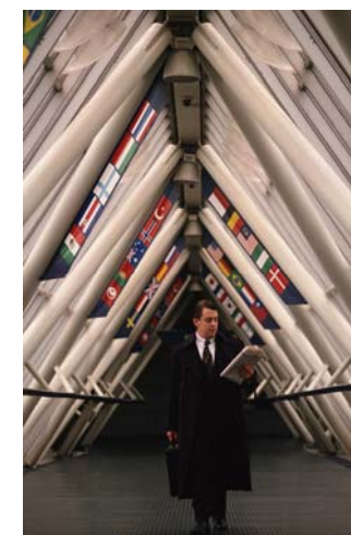
Die TechConsult GmbH hat sowohl nationale als auch internationale Markterfahrung

So sichert sich der Kunde eine kontinuierliche Research- und Beratungsdienstleistung um dauerhaften Erfolg zu sichern.