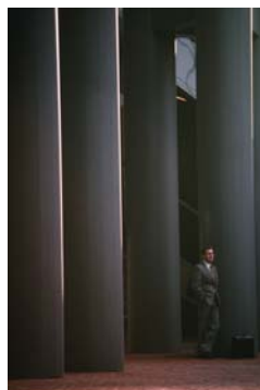
Die Services der TechConsult GmbH stehen auf vielen Säulen